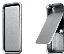
VÝKLOPNÁ ÚCHYTKA 30x60 mm